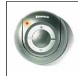
Pulsantiera 433,92 Mhz a codice variabile, a 2 o 4 canali. Dotato di contenitore per fissaggio a parete. (caratteristiche complete pag.178)