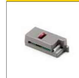
Scheda caricabatteria. Consente di caricare due diverse tipologie di batterie: nichel metalidrato e piombo.