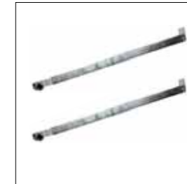
Coppia di bracci dritti zincati con bussola saldata completi di accessori per il fissaggio (L=600 mm).