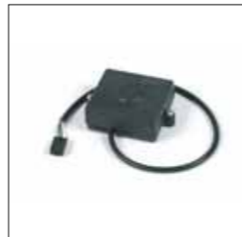
Dispositivo magnetico per rilevazione ostacoli e gestione rallentamenti.