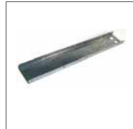
Piastra L= 650 mm.