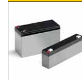
DA.BT6: Batteria 7Ah 12 VDC DA.BT2: Batteria 2,1Ah 12 VDC Le batterie DA.BT6 necessitano di box esterno.