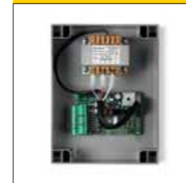
Centrale di comando con ricevitore integrato per ZED.24SC a 24 Vdc (caratteristiche complete pag.163)