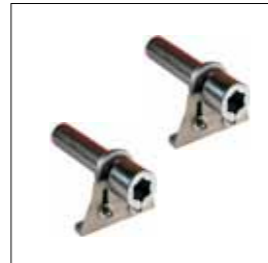
Coppia di tubi L. 150 mm. con bussola saldata e zincata completi di accessori (montaggio laterale).