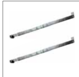
Coppia di bracci dritti zincati con bussola saldata completo di accessori per il fissaggio (L=2000 mm).