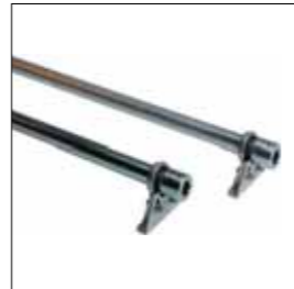
Coppia tubi zincati con bussola L. 1.500 mm (AU.45Z) e L. 2.000 mm (AU.45ZL) completi di accessori (montaggio centrale).