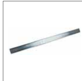
AU.125: Piastra L. 1.250 mm. AU.20: Piastra L. 1.950 mm.