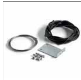
Sblocco a filo.