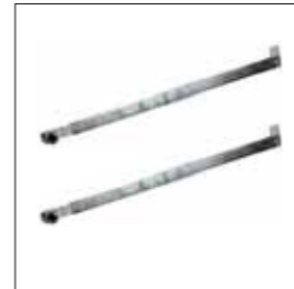
Coppia di bracci dritti con bussola per montaggio centrale senza saldature (L=600mm).