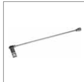
Sblocco esterno da collegare alla maniglia della porta basculante.