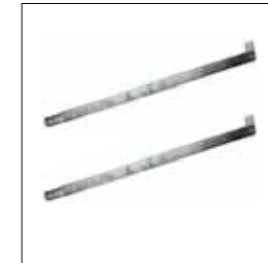
Coppia di bracci dritti zincati completi di accessori per il fissaggio (L=600 mm).