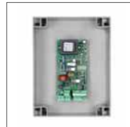
Centrale di comando 230 Vac con ricevitore integrato per ZED.SC / ZEDL.SC con gestione encoder. Necessita di accessorio MAG.E (caratteristiche complete pag.153)