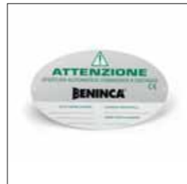
Tabella segnaletica in alluminio.